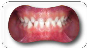
caso di Terza Classe

Si suggerisce ai partecipanti di portare con sé eventuali modelli in gesso da utilizzare per lo svolgimento della parte pratica.