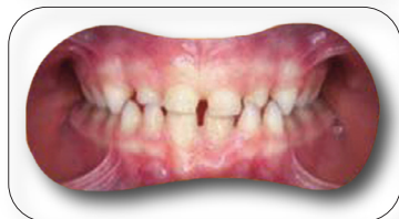
caso di Seconda Classe